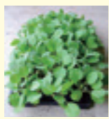
(商品例) キャベツ苗