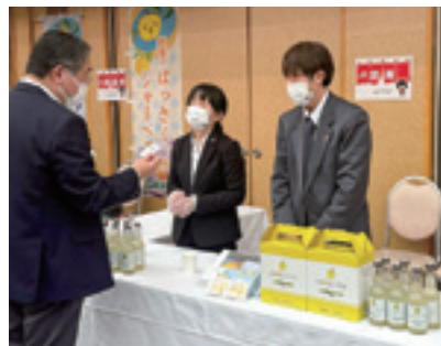
問 安芸津アグリセンター (0846) 46-1017

5月に開催されるG7広島サミットに先駆け、広島県の食と農の魅力を発信する発表会が2月28日開催され、JAグループ広島から、県内JAならびに連合会が参加しました。 当日は、じゃぼんサイダーの試飲を行ない、多数のメディアの方、食品を取扱う企業にJA芸南の特産物の魅力を発信することができました。