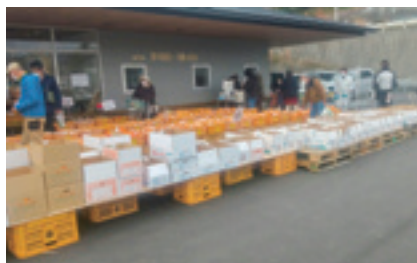
問 ふれあい市安芸津店 (0846) 46-1166

朝の開店前から行列となり、駐車場もいっぱいになってきたので、5分早く開店。朝一のお客様のお目当ては、「ハウスせとか」!!山積みだった「せとか」の箱がみるみるうちに低くなっていきました。当日は、いつもの「珍味屋さん」「タオル屋さん」、今回初登場の「花屋さん」が、参加してください、イベントを盛り上げていただきました。